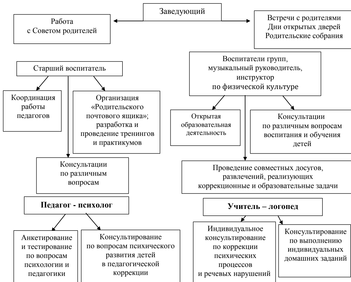
Рис. 1 «Схема взаимодействия с семьями воспитанников»